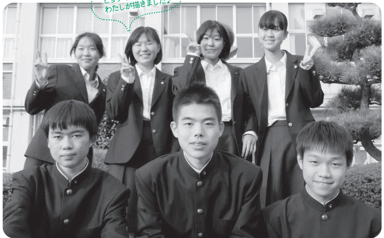
トウコちゃん ヒョウくんはわたしが描きました!

成年年齢が18歳に引き下げられ、高校生にも選挙権が与えられるようになりました。でも…。正直私たち、政治のことも選挙のこともよく分かりません! 同じ気持ちの人もきっといるはず……。だからまずは、子供と大人の政治の考え方についてアンケート調査して実態を明らかにしてみたいと思います! そして、政治や選挙に少しでも興味を持ってもらえたらうれしいです!