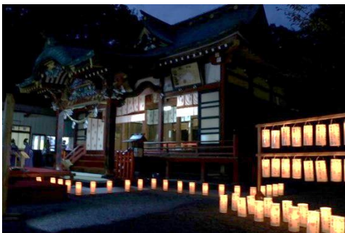
過去に実施した燈籠宵まつりの様子