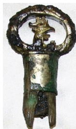
小泉長塚1号古墳出土 単鳳環頭大刀

小泉長塚1号古墳出土の単鳳環頭大刀は柄頭の他に刀身の部分が一緒に発見されており、調査記録から全体の長さが92cmほどの大刀であったことがわかります。この大刀のモデルとなる特徴を持つ刀が、今のところ日本国内では見あたらないことから、朝鮮半島で製作されたものが舶載された可能性が指摘されています。渡来工人在日本で製作した可能性も考える必要があるかもしれません。