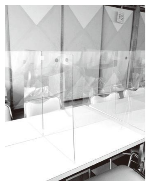
パーティションによる感染拡大防止対策

さらに飲食店を対象として、パーティションの設置や換気設備の強化等の感染拡大防止対策事業、及びテイクアウトやネット