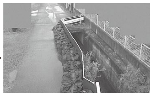
矢川のライブカメラからの映像