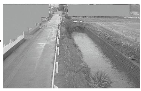
高橋川のライブカメラからの映像