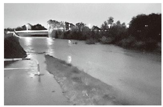
台風19号での増水の様子。上福島の土手の上面近くまで水が迫ってきた。