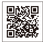
ライブカメラの映像はこちらから