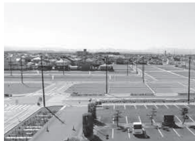
公園整備を待つ区画

第Ⅱ期分譲分の造成工事等が終了したため減額となりますが、今後は区画内の道路築造工事や公園整備等を行います。