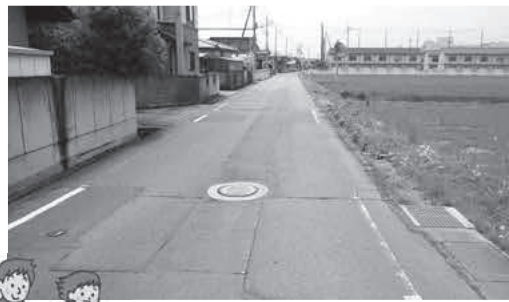
自転車道が整備される道路

国道 354 号から玉村高校までの区間について、自転車通行空間の整備・充実による安全確保を図ります。