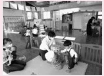
▲ママ見て…上手にできたよ!

11月12日のおたのしみ会では、4つのゲームのほか、クリスマス制作を楽しみました。親子でコミニケーションを取りながら嬉しそうに参加する姿がみられ、小さい子ものびのびと遊ぶことができました。館内にはたくさん大満足といった様子。最後に、手作りの自動販売機からお土産が出てくることに目を輝かせ、パパやママたちからは「すごい!」と驚きの声が上がりました。