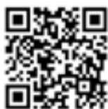
申込専用ホームページ