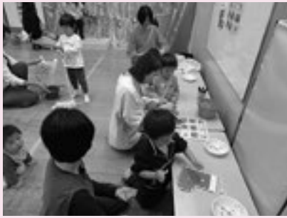
▲あと少しで完成かなあ…

11月12日のおたのしみ会では、4つのゲームのほか、クリスマス制作を楽しみました。親子でコミニケーションを取りながら嬉しそうに参加する姿がみられ、小さい子ものびのびと遊ぶことができました。館内にはたくさん大満足といった様子。最後に、手作りの自動販売機からお土産が出てくることに目を輝かせ、パパやママたちからは「すごい!」と驚きの声が上がりました。