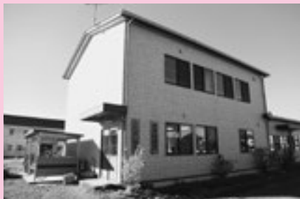
教育支援センター「ふれあい」