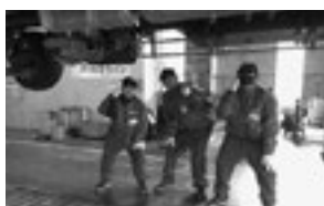
S G モーターズ

仕事で大切なことは、周囲の人としっかりコミュニケーションをとることだと分かった。設備点検で、工場内を隅々まで巡回する姿に、仕事の大変さややりがいを感じた。今回の職場体験を通して、夢である工業系の仕事に就きたいという思いをさらに強く持った。(株式会社岩手村田製作所)