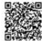
混雑予想カレンダー (町ホームページ)

住民課（役場1階①番窓口）の混雑緩和のため、マイナンバーカードをお持ちの場合は、役場に来庁せずに行える手続きがありますので、マイナンバーカードでの手続きをご活用ください。また、混雑が予想される日時などを避けての来庁にご理解・ご協力をお願いします。