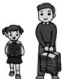
みんなで資源のリサイクルをしましょう

なお、ざつ紙、新聞、段ボール、紙パックや雑誌などの古紙類は、地区の子供会による集団回収や、地区公民館等で拠点回収をしている場合がありますので、不明な点は、地区役員やクリーンセンターにお問い合わせください。