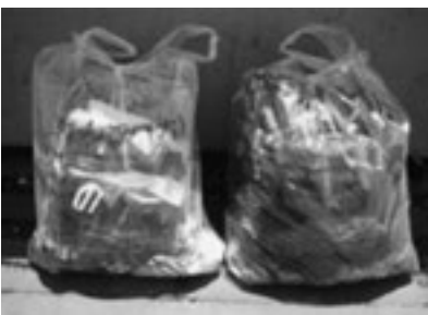
洗濯し乾かしてから出してください 古着は主に海外でリサイクルされます

古着類も濡れてしまったりユース、リサイクルできませんので、雨の日には出さないでください。また、役場玄関、図書館、社会体育館、B&G海洋センター、老人福祉センター、総合運動公園、北部公園にリサイクルボックスを設置していますので、こちらもご利用いただけます。