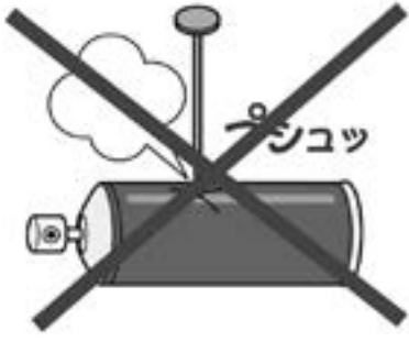
穴は開けないでください！

以前は、ヘアスプレーや殺虫剤スプレーなどのスプレー缶は、使い切った後に穴を開けて出していただきましたが、現在は、使い切った後に穴を開けずに出していただいています。スプレー缶の穴あけ作業中の爆発事故等が全国的に発生しているためです。中に入っているガスは、多くが可燃性のガスとなっていますので、 使い切らなかつたスプレー缶は、火気のない屋外で古布などにスプレーし、ガスを 出しきってください。