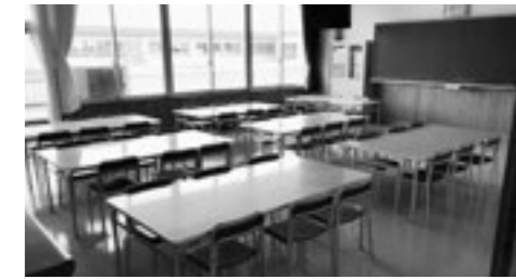
玉村小学校放課後児童クラブ