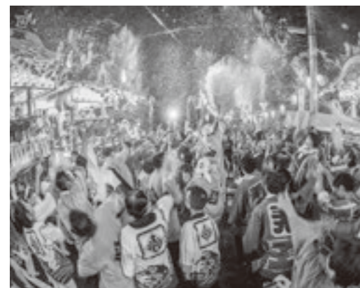
「第2回たまむらの風景フォトコンテスト」 グランプリ作品