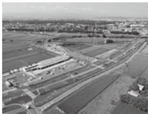
高崎玉村スマートIC周辺地区