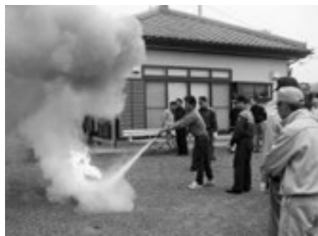
地域防災活動の様子