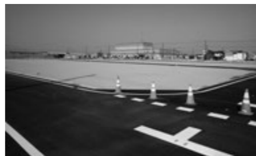
文化センター周辺地区