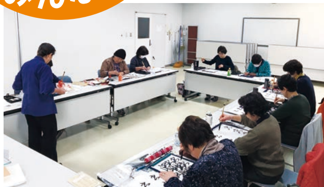
みんな真剣! 練習風景