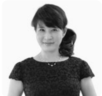
子育て本著者・講演家 立石 美津子氏