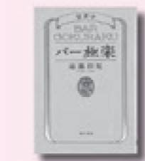
バー極楽 BAR GOKURAKU 遠藤 彩見 著 KADOKAWA

6年間の放蕩の果てに実家の寺に戻った照月。全ての欲を捨てた彼の前に現れたのは、欲望全開の美人姉妹。彼女たちが境内に開いたバーには、連日煩惱まみれの客がトラブルを持ち込み…。『文芸カドカワ』連載に加筆し単行本化。【TRC MARC】