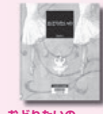
おどりたいの 豊福 まきこ 作 BL出版 対象 0～5歳

森のはずれでバレエに出会った、まっ白な子うさぎ。一目で優雅な世界に引き込まれたうさぎは、勇気をだして扉をたたきます。先生は優しく迎えてくれて、やがて…。知らない世界に飛び込む勇気を、後押ししてくれる絵本。【TRC MARC】