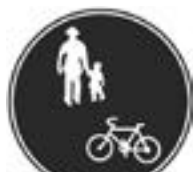
歩行者および 自転車専用