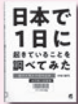
日本で1日に起きていることを調べてみた 宇田川勝司 著 ベレ出版