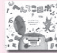
へんてこロボ セルジオ・ルツィア 著 ミシェル・ロビンソン 光村教育図書 対象 幼児(0~5歳)

1日に、日本とその周辺で発生する地震の回数は? 1日に、救急車が出勤する回数は? 自然現象から日々の暮らしの中の出来事まで、意外に知らない現代日本の姿を1日という時間を尺度にした数字で明らかにする。 [TRC MARC]