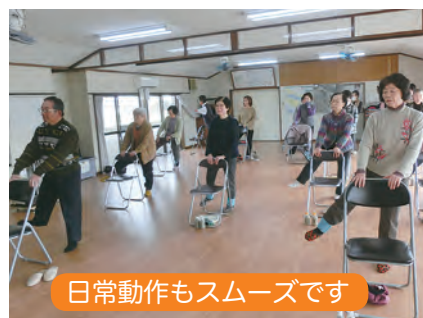
日常動作もスムーズです