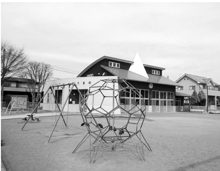
多くの子どもが通う児童館

主な内容 町の放課後児童クラブ使用料は県内他市町村に比べて安価で、保護者の負担割合も国の想定する基準（運営費の2分の1）を大きく下回っているため、平成30年度、