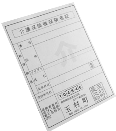
誰もが安心して暮らせる仕組みを

主な内容 介護保険料は3年ごとに見直しを行っており、平成30年度は改定の年になります。30～32年度の介護保険料は、介護報酬の引き上げなどによる介護給付費の増加が見込まれることから、基準月額が560円増額され、6870円となります。