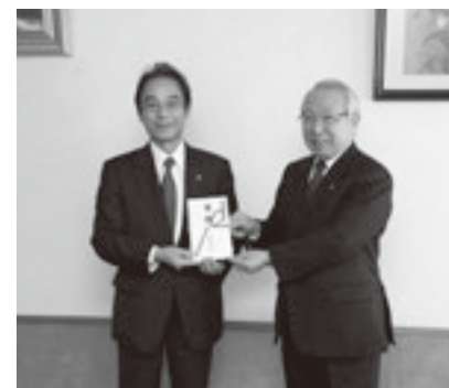
大変ありがとうございました。

○アイオー信用金庫様から創立90周年記念として現金100万円のご寄附をいただきました。