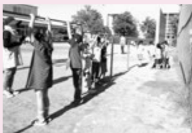
▲みんなでミッションをクリアしてキーワードを集めよう!

親子教室「七夕まつり」 もつすく「七夕」ということで、七夕の飾りと短冊を作りました。お父さんやおばあちゃんも参加してくれ、みんなで楽しく作ることができました。七夕シアターを観て、冷えたみかん入り牛乳かんを食べ、とても嬉しそうでした。みんなの願い事がかないますように!!