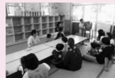
親子教室「七夕まつり」

親子教室「七夕まつり」 もつすく「七夕」ということで、七夕の飾りと短冊を作りました。お父さんやおばあちゃんも参加してくれ、みんなで楽しく作ることができました。七夕シアターを観て、冷えたみかん入り牛乳かんを食べ、とても嬉しそうでした。みんなの願い事がかないますように!!