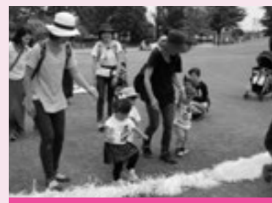
親子教室「北部公園で遊びました」