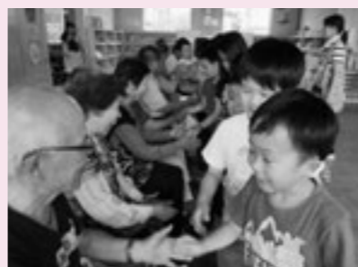
▲長寿会との交流会

「今年もよろしくお願いします。」という意味を含めて、握手をしました。 5月12日におじいちゃんおばあちゃんに来て頂き、○×クイズをして楽しみました。