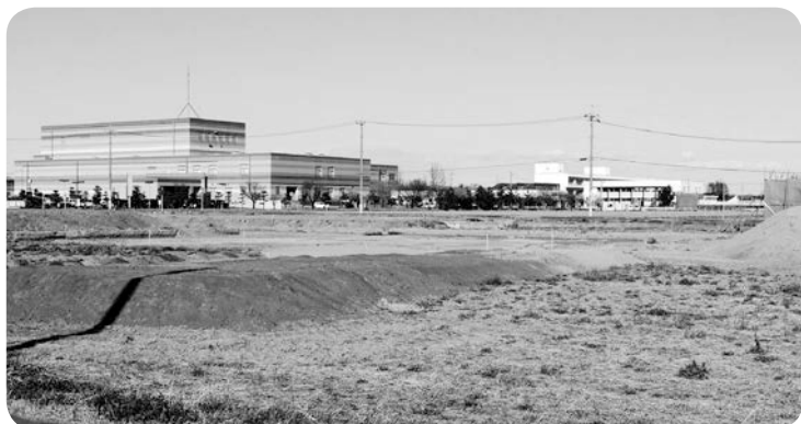
宅地造成が進められている文化センター周辺