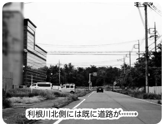
利根川北側には既に道路が……

答弁 町長 本年度の売り上げ目標は4億円としており、7月が約2700万円、8月が約2600万円とほぼ目標