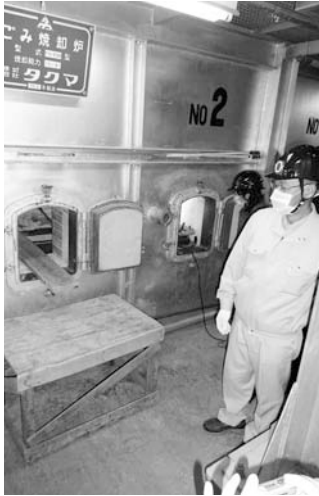
クリーンセンター内の 焼却炉点検口

また、たばこ税や特別土地保有税の不申告についても、過料の上限を10万円とする規定が新たに加わります。