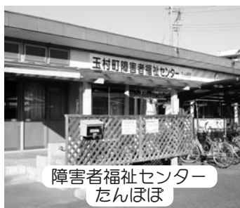
障害者福祉センター たんぼぼ