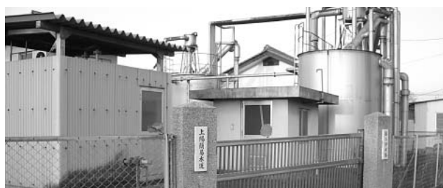
旧上陽簡易水道施設

Q 教育長 小、中学生とともに、全国、県と同じ傾向だった。調査内容は、学習指導要領に示された「基礎・基本」の一部である。調査結果を分析し、これまでの教育課程や指導方法の課題を明らかにし、「よくわかる楽しい授業づくり」「学習に必要な生活習慣づくり」など、きめ細かな指導につなげていきたい。