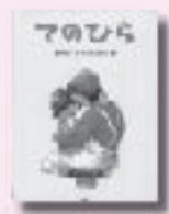
てのひら ふじたひおこ なせむら あり 瀧村有子 作 PHP研究所

秘密結社を結成して、不思議な事件の謎に挑んでいた僕ら。そんな小3の2学期の始業式の日、不思議な力を持った少年が転校してきて……。ちよっぴりほろ苦い少年たちの成長物語。『小説トリッパー』連載を加筆修正して単行本化。