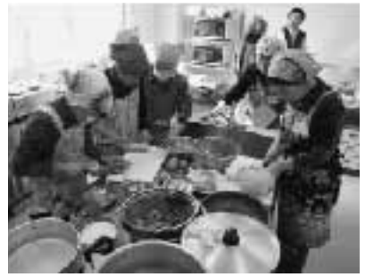
詳しくは、経済産業課まで。

伊勢崎調停協会主催 民事・家事調停相談会 伊勢崎簡易裁判所 ☎(25)00887 土地・建物、金銭の貸し借りや交通事故、離婚、扶養、遺産相続などでお悩みの人は、ぜひご相談ください。相談は無料で秘密は厳守します。また、予約は不要ですので、直接会場へお越しください。 日時 6月11日(金) 午前9時～午後4時 場所 伊勢崎市文化会館2階大会議室 相談担当者 裁判所民事・家事調停委員