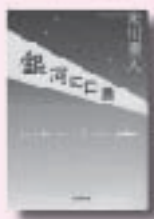
ざんが くちぶえ 銀河に口笛 しめかわ りよ 朱川 遼 著 朝日新聞出版

伊勢崎佐波地区の小・中学校 の代表者が描いた、むし歯予防の図画ポスター・標語展 展示期間 6月4日(金)～10日(木) 場所 ベイシアIS 伊勢崎店 詳しくは、伊勢崎佐波歯科医師会まで(メールアドレス http://www.14.ocn.ne.jp/~tsda/ )