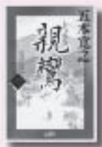
しんらん 親鸞 上・下 いっさきごもん 五木寛之 著 講談社

愚者か? 悪人か? 聖者か? 地獄は一定と覚悟し、真実を求めて時代の闇を疾走する青春群像一。新しき人間・親鸞を描く。全国27新聞での連載に加筆修正し書籍化。