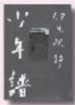
少年譜 Ichiya Ichiya 伊集院静 著 文藝春秋

誰と出会い何を学ぶのか。 少年時代は黄金期である…。 炭焼き小屋の老夫婦にもら われた少年の数奇な運命を描 く表題作ほか、幻の短篇 2作を含む、人生の喜びと 厳しさを活写する少年小説 集。