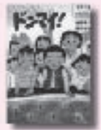
ドンマイ! Don't Worry! 後藤竜二 作 福田岩緒 絵 新日本出版社

やる気十分少女、エミリの 提案で、ほくらは3年1組 の畑にチューリップの球根 を植えることになった。冬 のマラソン大会が終わった ころ、ようやく芽を出した チューリップだったけど…。 シリーズ完結編。