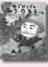
ねぎぼうずのあさたろう その1 いいのかずお 飯野和好 作 福音館書店

痛快な男たちの生きざまを見よ! 明治43年、わずか204トンの木造帆船開南丸で南極探検を執行した探検隊の物語。南極観測船「しらせ」に名を残す、世界的な日本人探検家・白瀬轟陸軍中尉の感動の生涯を描く。