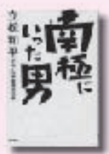
南極にいった男 たぢまなへい 立松和平 著 東京書籍