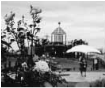
最優秀賞作品「梅雨の晴れ間」