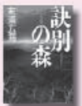
訣別の森 末浦広海 著 講談社

場所 学校給食センター 定員 先着30人 参加費 250円 申込方法 10月20日(月) 31日(金)の午前8時30分～午後5時15分までに参加費を添えて直接学校給食センターへ