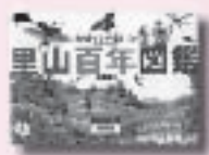
里山百年図鑑 松岡達英 作 小学館

ある日、ドクターヘリの機長が、墜落した取材ヘリを救出した。怪我人は、自衛隊時代にかつて愛した部下だった。そしてその夜、彼女は入院先から姿を消す。課せられた「使命」と「魂の絆」の狭間で、男たちが咆哮する。〔第54回江戸川乱歩賞〕