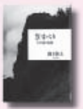
草すべり なぎけいし 南木佳士 著 文藝春秋

日時 11月1日(土)~3日(月) 午前9時~午後5時 (※3日は午後4時まで)