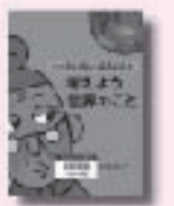
もったいないばあさんと考えよう世界のこと しんじゅ 真珠まりこ 作・絵 講談社

高校の同級生だった女性から手紙が届き、40年ぶりに再会して登った浅間山での1日。青春の輝きに満ちていた彼女だったが……。稜線を渡る風が身の内に吹き抜ける、4つの短篇を収録