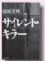
サイレント・キラー 結城五郎 著 角川春樹事務所