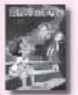
真夜中の学校で 川端裕人 作 鈴木びんこ 絵 小学館

医師そして看護師が次々と失踪した。義兄の残した「サイレント・キラー」という唯一のメッセージを手がかりに、若き医師の闘いが始まった。書き下ろし長篇医療ミステリー