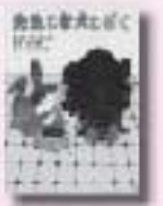
先生と老犬とぼく ルイス・サッカー作 はらるい訳 文研出版

マーヴィンは、ノース先生に、1週間留守をするからお願ひねと、老犬ワールドの世話を頼まれます。ところが、困ったことに、えさをまったく食べてくれません。獣医さんに相談しますが……。