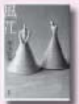
かざばな 風花 かみかみひろあき 川上弘美 著 集英社

のゆり33歳。拓哉と結婚して7年。拓哉には恋人が、のゆりにも年下の男との関係がある。すれ違う気持ちとところ。愛はいかにして色あせていくのか……。ゆるやかに推移する愛のかけ橋を描く長編恋愛小説