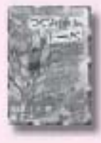
つぐみ通りのトーベ ビルレット・ロン 作 さえきあいら 佐伯愛子 訳 徳間書店

知乃と鮎美、和衣は高校時代からの親友。知乃には自分以外の恋愛を成就させるお祈りができる特殊能力があったが、自分たちはまだ独身だ。30代を迎えた彼女たちの前に現れるのは「運命の人」なのか? 恋愛ファンタジー