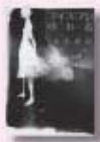
アイスマン。ゆれる かじおしんじ 梶尾真治 著 光文社