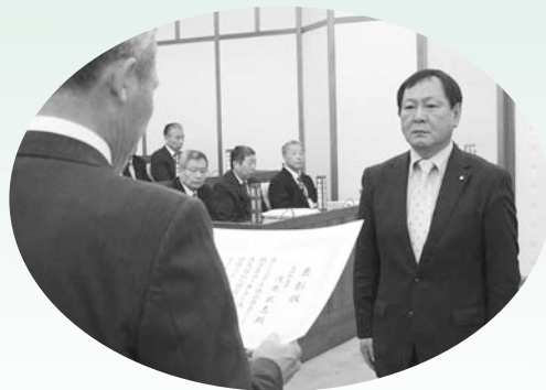
表彰の伝達を受ける宇津木前議長（左）と浅見議長（右）