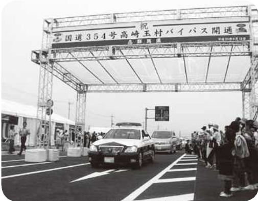
国道 354 号高崎玉村バイパス開通式 (6月12日)

A 町長 今後、地域振興を目標とする都市間競争は、ますます激しさを増すと考えている。そのためにも、玉村町らしさを内外にPRしていくことが重要と認識している。このためには、玉村町の地域資源の中から強みのあるものをセールスポイントとし、各種イベントを通じて内外に売り込んでいきたい。