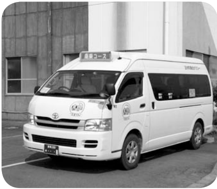
昨年度車両を入れ替えた『たまりん』

増便やタイヤ改正を望む声が多い中、経費面との調整が難しいことも理解できているが、早急に改善すべきである。65歳以上の運賃無料化を検討するなど、積極的に利用者を増やす努力を期待する。