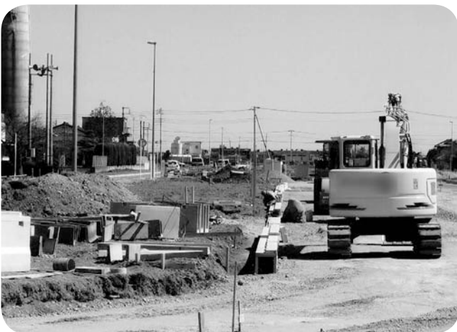
着々と工事が進む東毛広域幹線道路

う生かすかは、今後の町政の最大の課題であると考えられる。多くの町民の衆知を集めて、すばらしい道の創造を図るべきである。